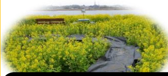
2015年3月 雨天後、道にシート設置