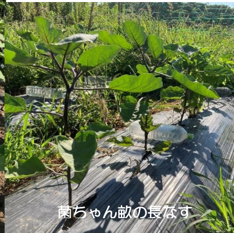
菌ちゃん畝の長なす