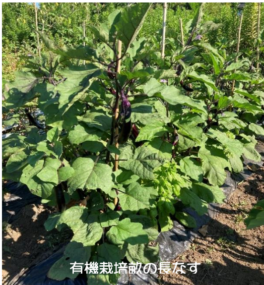
有機栽培畝の長なす

◎有機栽培畝：3/15 播種→5/28 植付け→7/29 収穫中・・・今年のなすは豊作です！