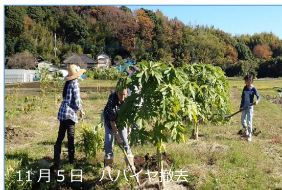
11月5日 パパイヤ撤去