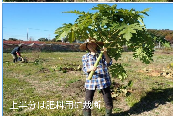
上半分は肥料用に裁断