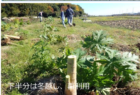
下半分は冬越し、再利用