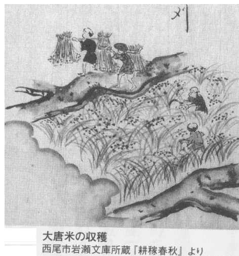
大唐米の収穫 西尾市岩瀬文庫所蔵「耕稼春秋」より

赤米には中世にインドから渡来したインディカ型赤米（ だいとう 大唐米）と、それ以前に渡来していたジャポニカ型赤米があった。寒冷地ではジャポニカ型が、それ以外ではインディカ、ジャポニカ両型が植えられていたという。インディカ型の大唐米は条件の悪い土地でも短期間に育つので、新田が開発されるとまず栽培されたようだ。