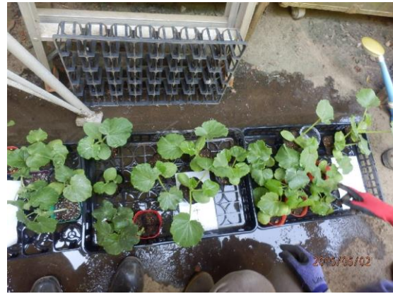
手塩に掛けて育てたカボチャ