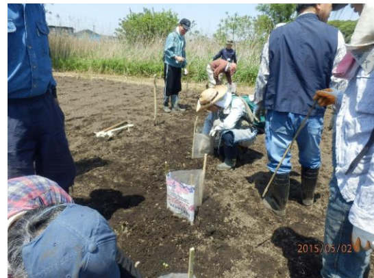
あんどん 今年こそは