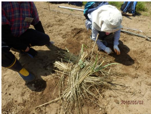
甘いスイカを期待して