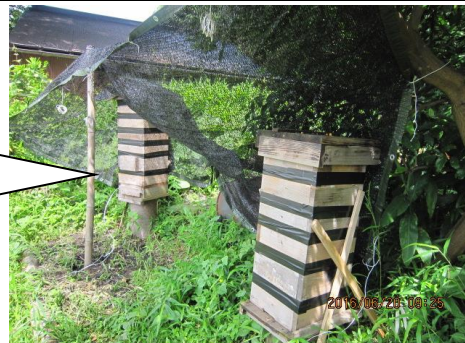
6/18寒冷紗設置2日後には蜂たちも落ち着いた