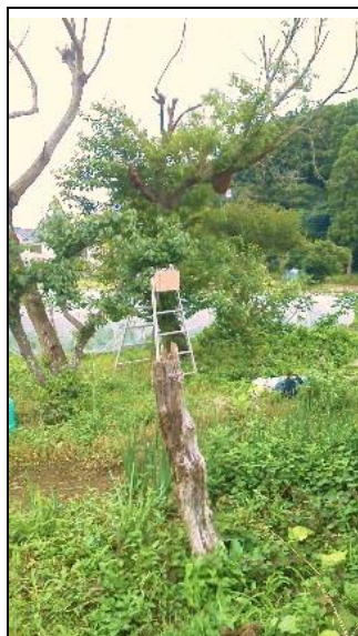
写真の左側がトウモロコシ畑です。

(この塊の形状ですと女王様が必ずおる状態ですね、今度は完全に巣門を2~3日閉じるなど試行してみたいものですね。) (谷口)