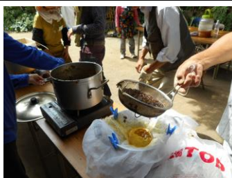
金網(粗精製) オーガンジー(二次精製)同時処理？

オーガンジーで上手いいかないね。金網だけにしてスピードアップ。二次精製は後日、処理しましょう。