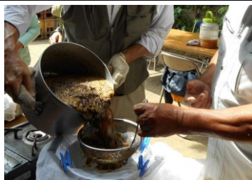
寸胴鍋は重いので気をつけてね