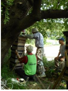
桜の下東(老の箱)の継ぎ枠