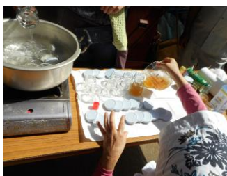
ビンを自然乾燥の後ハチミツのビン詰め