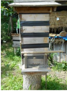
窯前越冬3の巣箱もこのあと先週に続き継ぎ枠 2段足して7段として完了