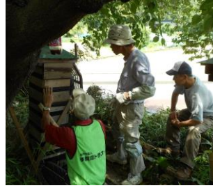
揺れを防ぐため補強板で固定