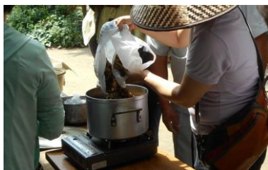
蜜蝋精製：蜜を絞った粕を寸胴鍋に入れます。