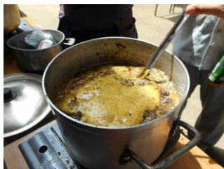
蜜蝋が浮き始めましたね。