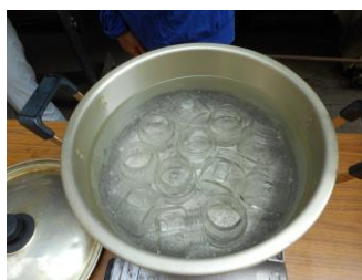
ビンの煮沸消毒15分