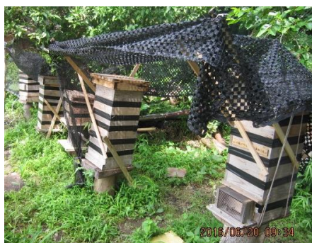
蜂さんたちの活躍を期待します