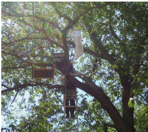
蜂球を補虫網に掻き落とす