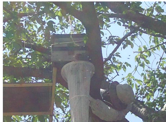
補虫網を収容箱の下に移動、蜂を這い上がらせる