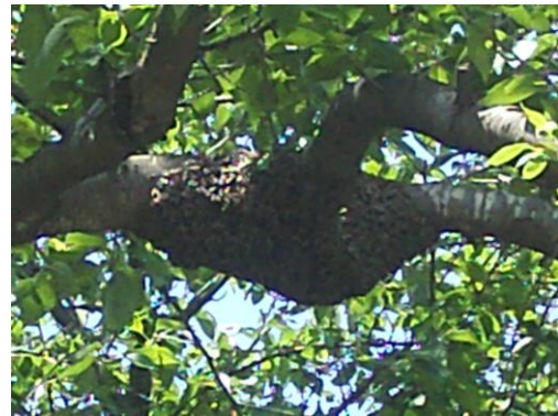
蜂球を拡大したところ