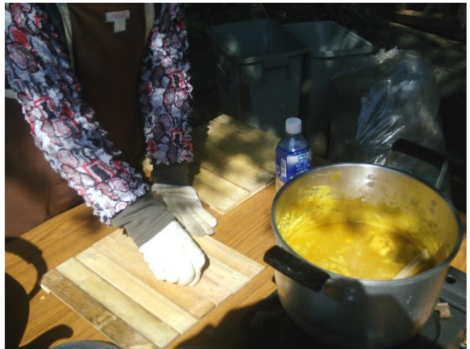
天板簀の子の蜜蝋の塗布